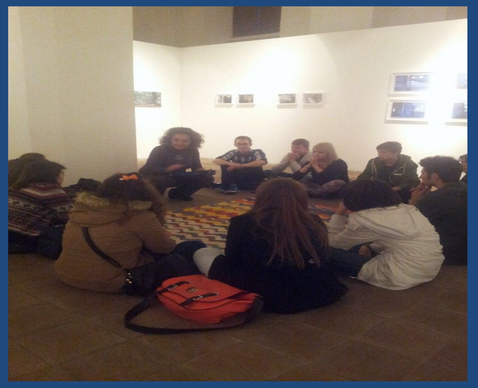
Workshop on sounds