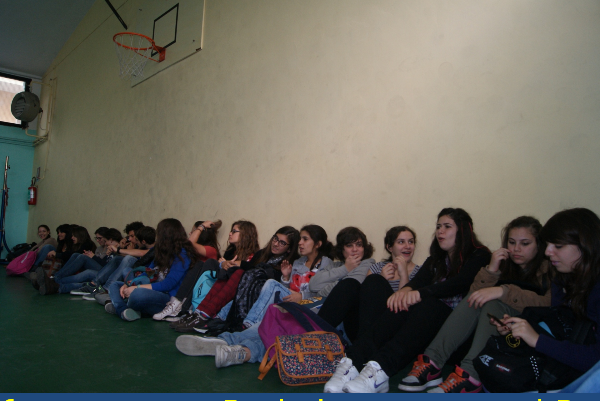
formance on Body language and Da