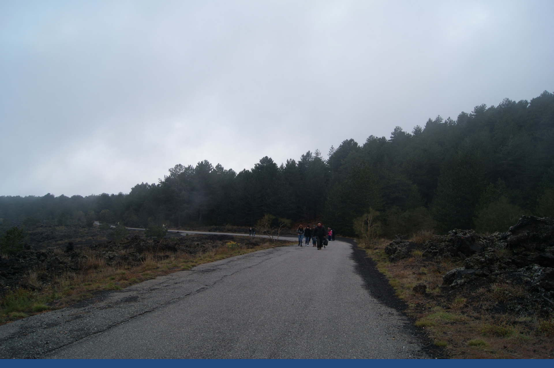
Excursion on Mount Etna