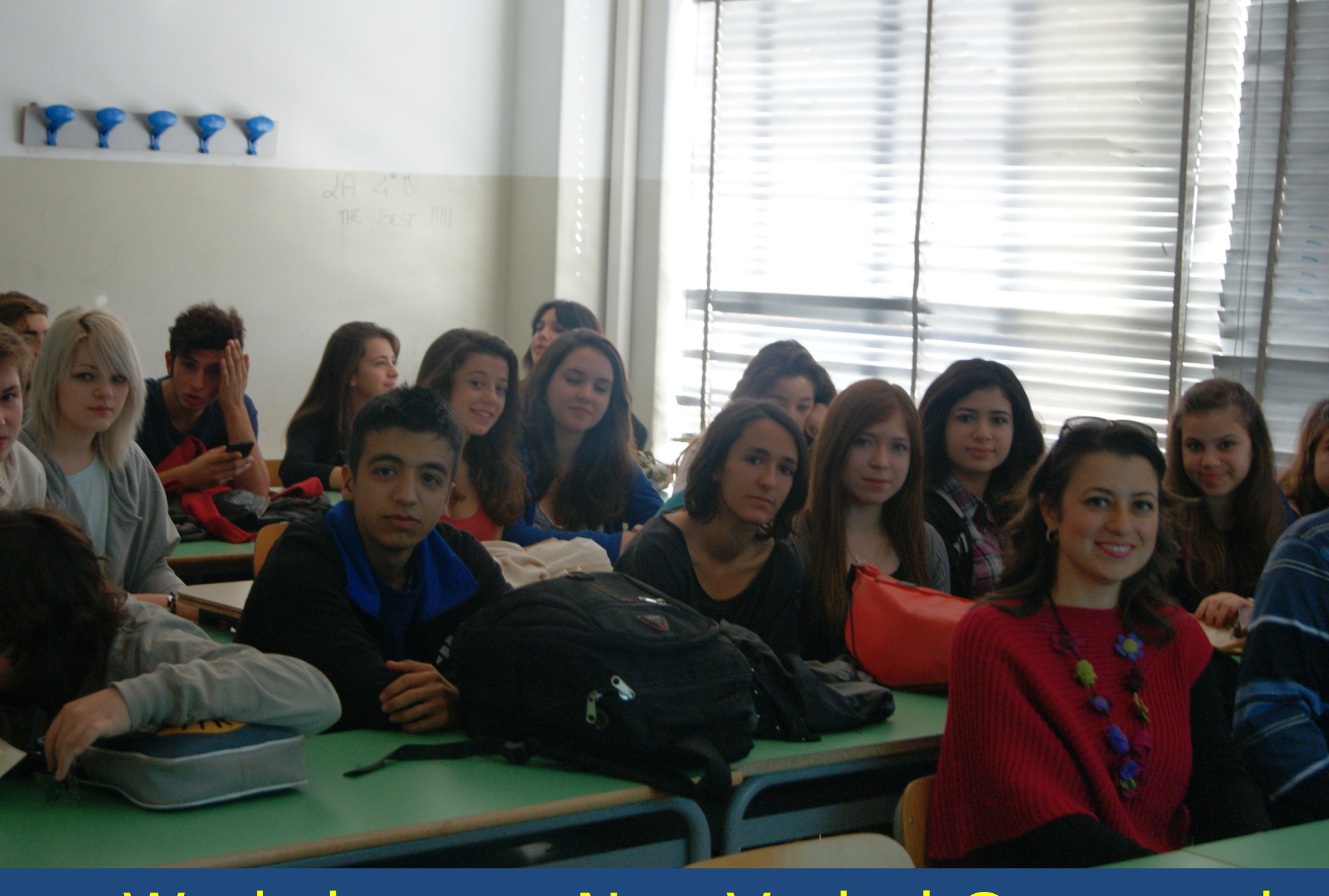
ma Workshop on Non-Verbal Communica