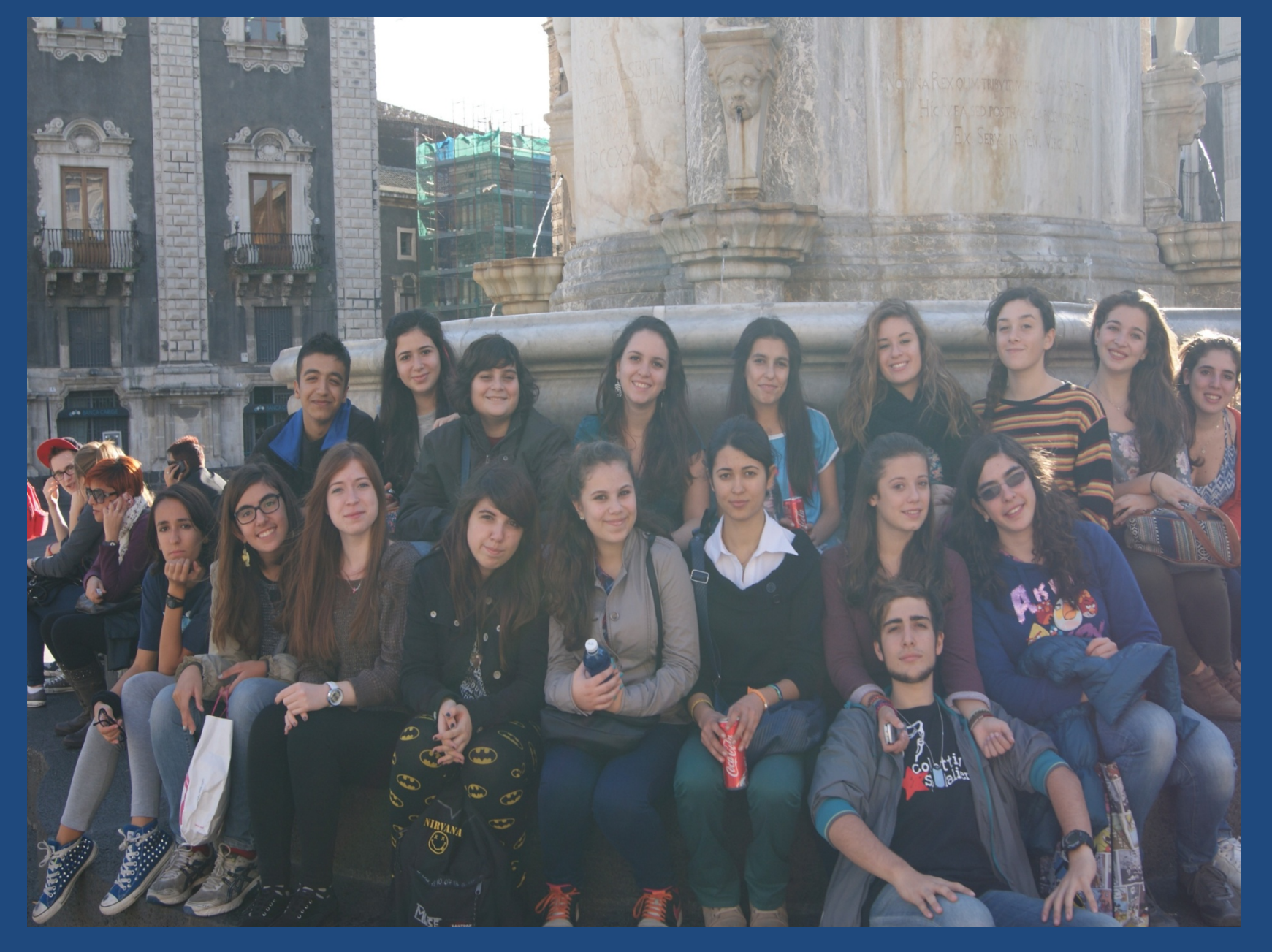
Walk in the city centre